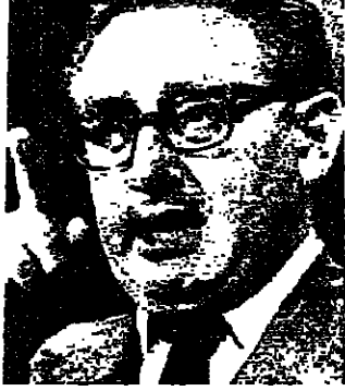
كينجسبرج يتحدث بؤنبره الصحفي

قالت وكالة «أسوشيتد برس» الأمريكية في واشنطن ، أن واشنطن تأمل بالعودة الى سياسة الخطوة خطوة . وقالت الوكالة ، أن واشنطن تأمل بالعودة الى سياسة الخطوة خطوة . وقالت الوكالة ، أن واشنطن تأمل بالعودة الى سياسة الخطوة خطوة .